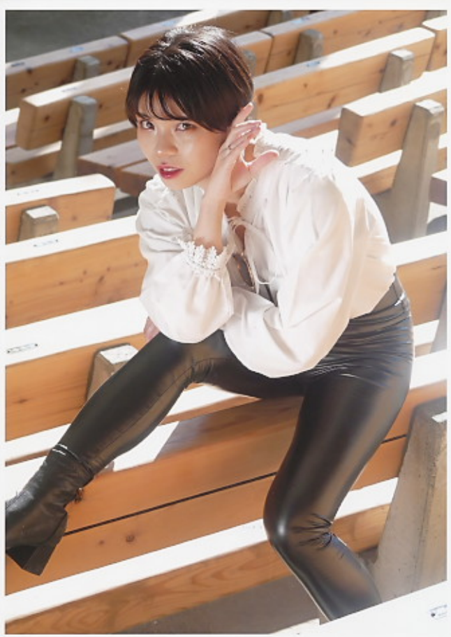
入選 「午後の光」 田沼 靖信 様 モデル 彩兎宇 すす